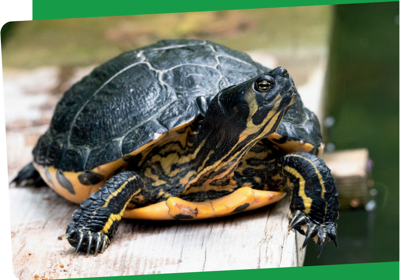
Gelbwangen-Schmuckschildkröte ( Trachemys scripta )